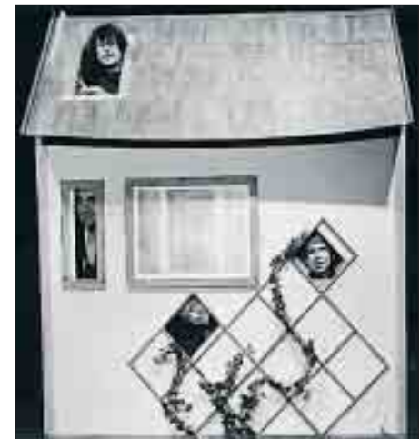
Noch im Start-Jahr 1997 gab es das Nürnberg-Stipendium fürs Ka-Li-Quartett im Puppenhaus