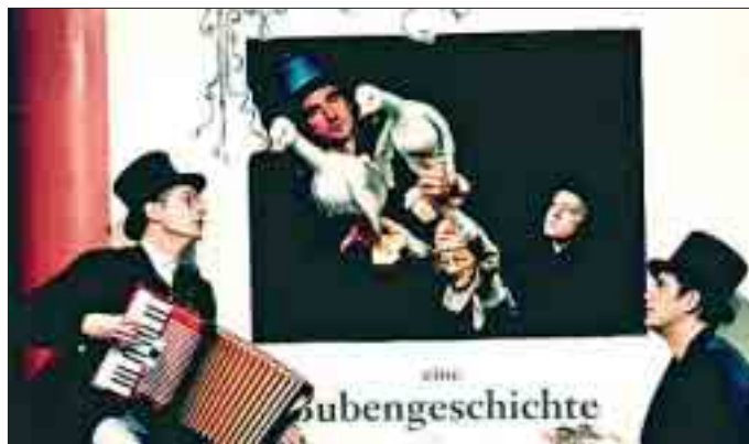
Moritat mit rabenschwarzem Humor: „Max und Moritz“ nach Wilhelm Busch, eine Groß-Produktion von Salz & Pfeffer.