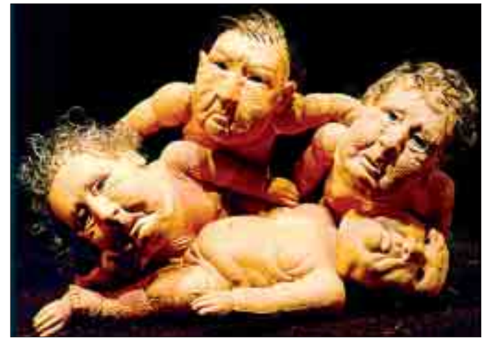
Fränkische Passion: „Zwerg“ und wie sie sich strecken zeigten Tristans Kompagnons in Worten von Kusz und Puppen von Joachim Torbahn