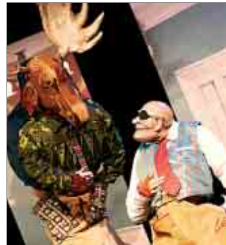
Lauter lädierte Figuren: Mit „Olaf der Eich“ entdeckten Salz & Pfeffer die Umhänge-Maske